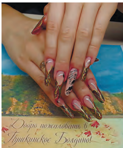
Анастасия Liberty (частный мастер, Заволжье, Россия)